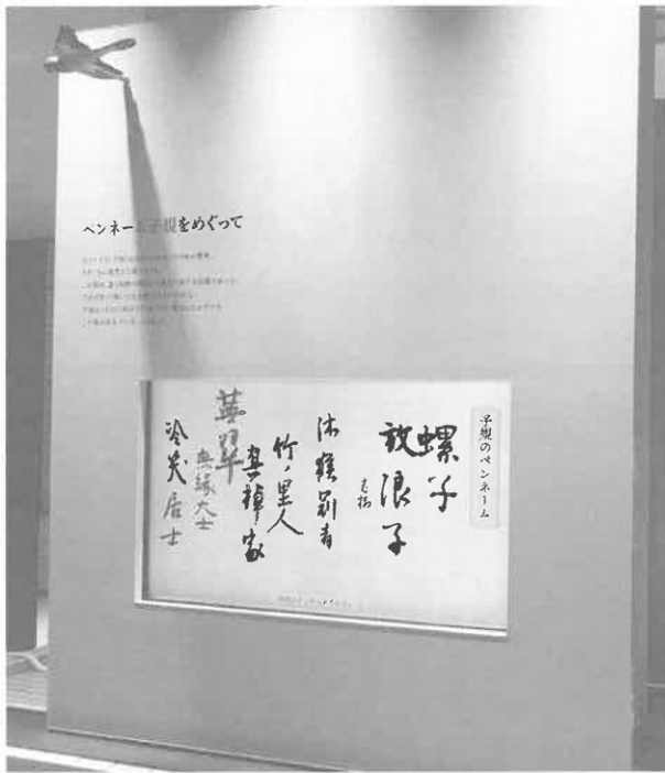
▲子規が考えたペンネームを64個紹介しています。 (右はその読み方)