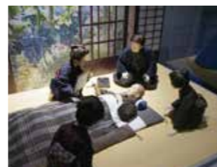
人偶 子规的“绝笔三句”