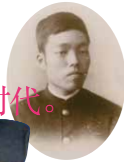
学生时代的子规 子规的学生帽