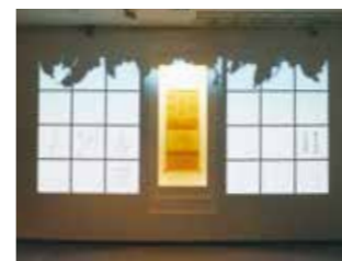
子规俳句“绝笔三句” ※碰触文字，俳句将会依顺序浮现