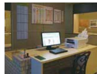
“试着写首俳句吧！” ※可以将自己写的俳句印制成短笺