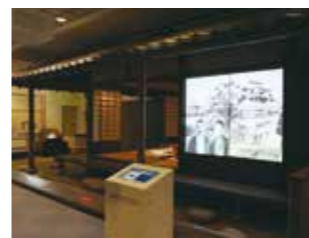
影像区 “以影像认识愚陀佛庵”