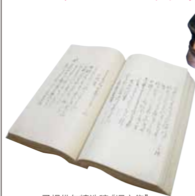
子规俳句精选稿“旧交集”