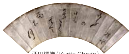
栗田樗堂 (Kurita Chodo) “今日也有可喜可贺日落夏之月”